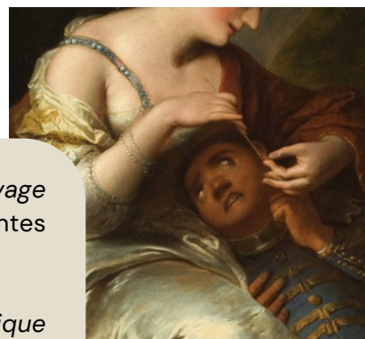
Le percement de l'oreille Anonyme, vers 1735

En 2021, l'exposition L'Abîme, Nantes dans la traite atlantique et l'esclavage colonial , usait de dispositifs biographiques pour rendre compte de la vie en servitude. Le musée s'interroge aujourd'hui sur l'approfondissement de l'expérience sensible, à travers la voix de ceux qu'on n'entend jamais directement dans l'exposition.