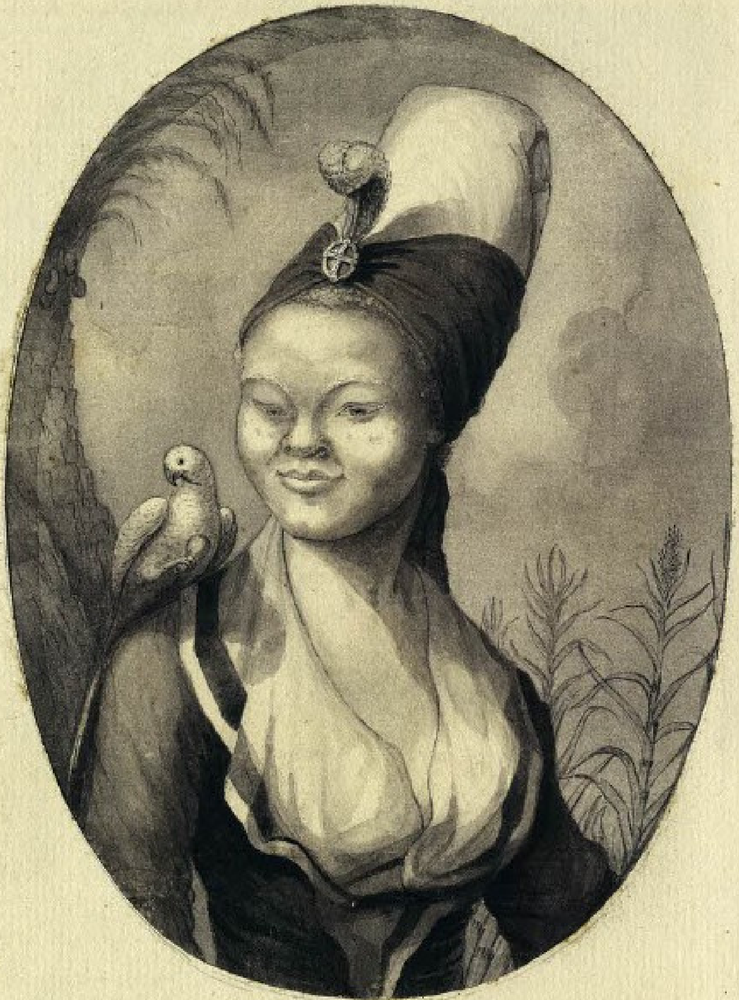
Portrait de Geneviève, Jean-Jacques DICQUEMARE, © Bibliothèque municipale de Rouen